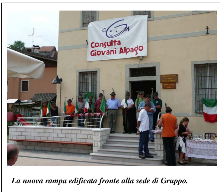
La nuova rampa edificata fronte alla sede di Gruppo.