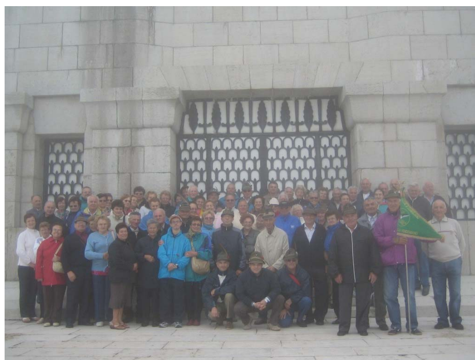
Cima Grappa. Gita sociale 13 luglio 2008.

45 anni dopo e nel 90mo dalla fine della Grande Guerra gli Alpini Sanvendemianesi ritornano sul Grappa per rendere Onore ai Caduti, ma non solo, quest’anno la Gita è un pellegrinaggio che vedrà i partecipanti rendere Onore anche ai caduti che riposano al Sacrario di Asiago per terminare con la Santa Messa all’Isola dei Morti. La partenza è come sempre di buon mattino e dopo l’alzabandiera fronte Sede, alle 6:30 i tre pullman partono in perfetto orario. Si susseguono gli scongiuri in auspicio del bel tempo, il Visentin si mostra in tutto il suo splendore, e anche se anno promesso brutto tempo, crediamo più a Lui. Siamo quasi in vetta al Grappa, e mentre ammiriamo il panorama che offre la montagna, una fitta nebbia fa calare il sipario. In vetta la visibilità è praticamente nulla. Troviamo generoso ricovero, al rifugio Bassano, dove il tanto