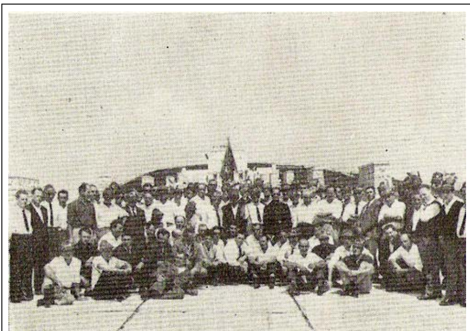
Cima Grappa. Gita sociale 21 luglio 1963.